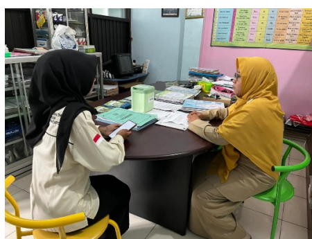
Gambar 2. Proses Wawancara