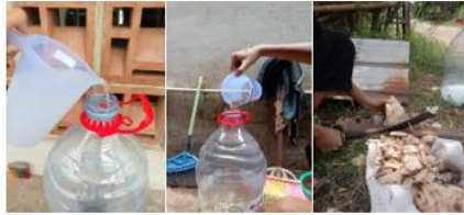
a. Pencacahan air cucian beras b. Penambahan Gula merah c. Penambahan

Tutup rapat botol penampungan serta selang pada penutup botol. Ujung selang dihubungkan pada penutup botol larutan MOL dan ujung lain dihubungkan ada wadah berisi air, sehingga gas yang terbentuk oleh fermentasi akan keluar tanpa adanya udara bebas yang masuk ke dalam botol penampungan.