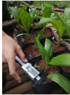
Gambar 8. Pengukuran diameter batang.