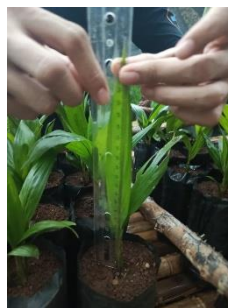
Gambar 7. Pengukuran tinggi tanaman

Variabel tinggi tanaman diukur menggunakan alat bantu penggaris, di mana jarak diambil mulai dari batas permukaan media tanah hingga ke titik ujung daun yang paling tinggi. Pengamatan ini dijadwalkan secara berkala setiap dua minggu sekali dalam masa pemeliharaan selama tiga bulan. Ilustrasi mengenai tata cara pengukuran tinggi tanaman tersebut telah disajikan pada Gambar 7.