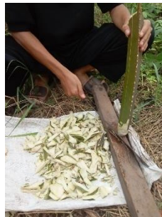
Gambar 2. Pencacahan pelepah

Pencacahan diawali dengan memotong pelepah menjadi beberapa bagian terlebih dahulu, kemudian cacah atau cincang pelepah kelapa sawit hingga berdiameter kecil. Hal ini karena proses pencacahan akan berdampak pada percepatan pengomposan pelepah. Pencacahan pelepah dapat dilihat pada Gambar 2.