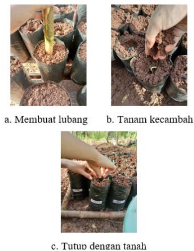
Gambar 5. Prosedur penanaman kecambah

Penanaman kecambah kelapa sawit pada penelitian ini menggunakan varietas Sue Supreme . Sebelum dilakukan penanaman kecambah, kecambah terlebih dahulu diseleksi. Seleksi kecambah yang layak ditanam adalah kecambah yang normal dengan syarat calon akar ( radikula ) dan calon daun ( plumula ) tidak searah, tidak patah, tidak busuk, dan tidak terkena jamur. Penanaman kecambah sedalam 2 cm di bawah permukaan tanah dilakukan dengan membuat lubang menggunakan kayu yang telah diberi tanda. Penanaman kecambah dilakukan dengan posisi plumula menghadap ke atas dan radikula menghadap ke bawah. Kecambah kemudian ditutup dengan subsoil. Proses penanaman dapat dilihat pada Gambar 5.