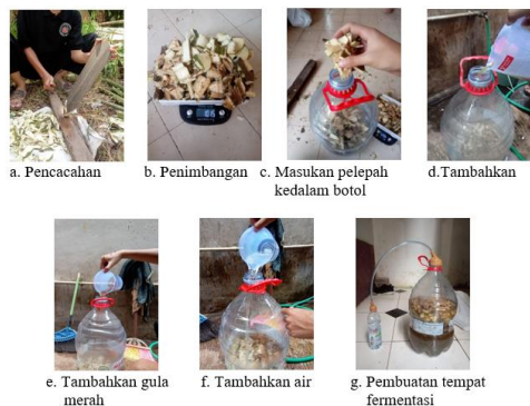
Gambar 4. Pembuatan POC pelepah kelapa sawit dekomposer MOL bonggol pisang

Pembuatan pupuk organik cair dimulai dengan penyiapan limbah pelepah kelapa sawit sebanyak 1 kilogram, kemudian pelepah kelapa sawit dicacah hingga menjadi bagian-bagian terkecil. Pelepah kelapa sawit yang telah dicacah dicampur dalam wadah, kemudian ditambahkan MOL bonggol pisang sebanyak 300 mililiter ke dalam campuran pelepah kelapa sawit tersebut. Pengadukan semua bahan dilakukan agar tercampur merata, setelah itu penambahan air ke dalam wadah sebanyak 10 liter dengan gula merah 100 gram. Wadah kemudian ditutup dengan rapat untuk melakukan proses dekomposisi pupuk organik cair selama 14 hari. Simpan wadah pada tempat yang terlindungi dari sinar matahari. Pembuatan POC dekomposer mol bonggol pisang dapat dilihat pada Gambar 4.