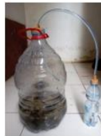
d. Pembuatan tempat fermentasi

Tutup rapat botol penampungan serta selang pada penutup botol. Ujung selang dihubungkan pada penutup botol larutan MOL dan ujung lain dihubungkan ada wadah berisi air, sehingga gas yang terbentuk oleh fermentasi akan keluar tanpa adanya udara bebas yang masuk ke dalam botol penampungan.