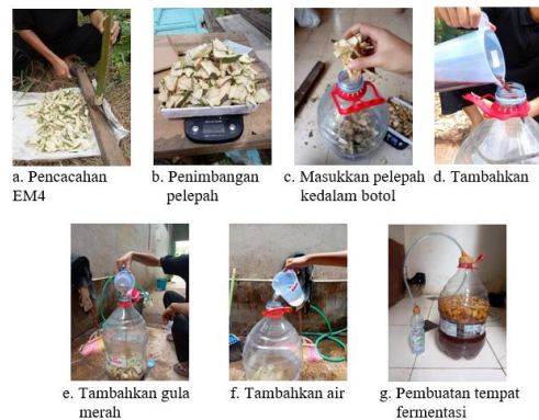
Gambar 3. Pembuatan POC pelepah kelapa sawit dekomposer EM4

Pembuatan pupuk organik cair dimulai dengan penyiapan limbah pelepah kelapa sawit sebanyak 1 kilogram, kemudian pelepah kelapa sawit dicacah hingga menjadi bagian-bagian terkecil. Pelepah kelapa sawit yang telah dicacah dicampur dalam wadah, kemudian ditambahkan EM4 sebanyak 300 mililiter ke dalam campuran pelepah kelapa sawit tersebut. Pengadukan semua bahan dilakukan agar tercampur merata, setelah itu penambahan air ke dalam wadah sebanyak 10 liter dengan gula merah 100 gram. Wadah kemudian ditutup dengan rapat untuk melakukan proses dekomposisi pupuk organik cair selama 14 hari. Pembuatan POC dekomposer EM4 dapat dilihat pada Gambar 3.