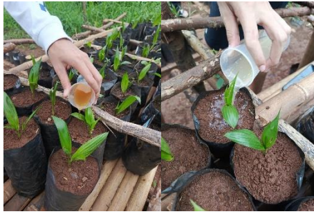
Gambar 6. Aplikasi POC pada bibit kelapa sawit.