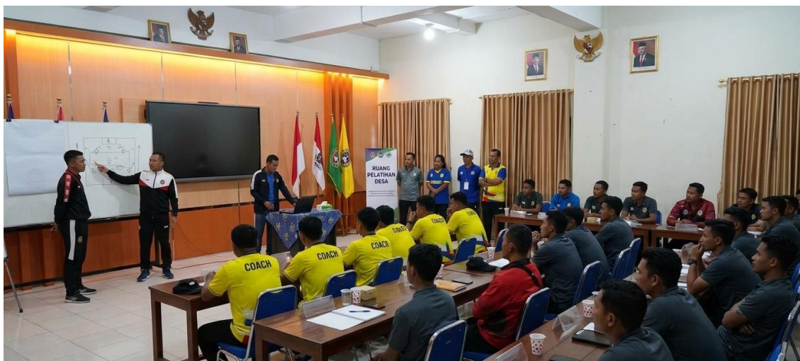
Gambar 2. Dokumentasi Pelaksanaan Kegiatan

Luaran yang dihasilkan dari kegiatan ini meliputi meningkatnya kompetensi pengetahuan mahasiswa mengenai kepelatihan olahraga, tersusunnya contoh program latihan sederhana yang dibuat peserta selama praktik, tersedianya instrumen evaluasi kompetensi pelatih berbasis pre-test dan post-test , meningkatnya motivasi mahasiswa untuk mengikuti sertifikasi pelatih, serta tersusunnya artikel ilmiah pengabdian kepada masyarakat. Luaran tersebut diharapkan menjadi dasar pengembangan program pelatihan lanjutan sehingga mahasiswa memiliki kesiapan yang lebih baik dalam menghadapi kebutuhan dunia kerja sebagai pelatih profesional.