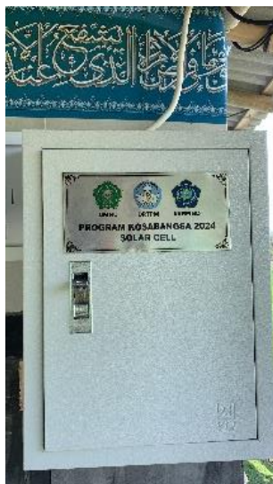
Gambar 4. Box panel PLTS