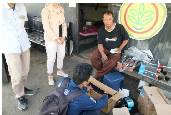
Gambar 6. Penjelasan Alur PLTS ke mitra