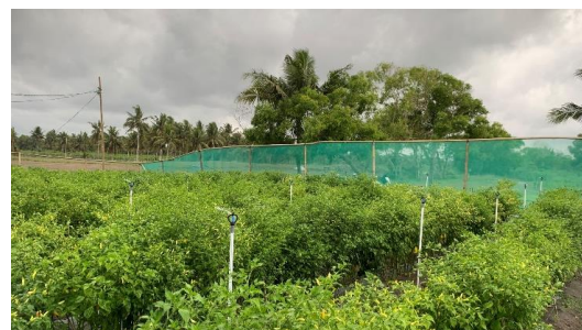
Gambar 7. Springkel dengan PLTS