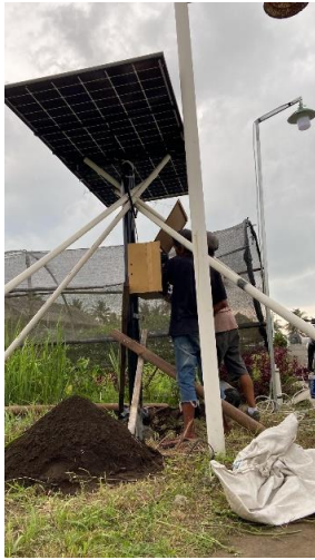
Gambar 2. Pemasangan PLTS