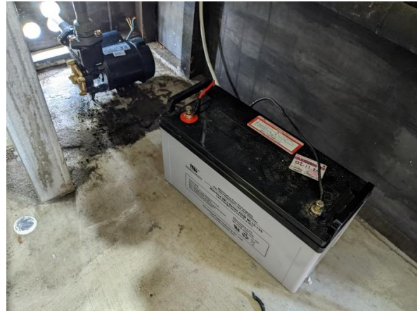
Gambar 3. Baterai penyimpanan arus Listrik PLTS