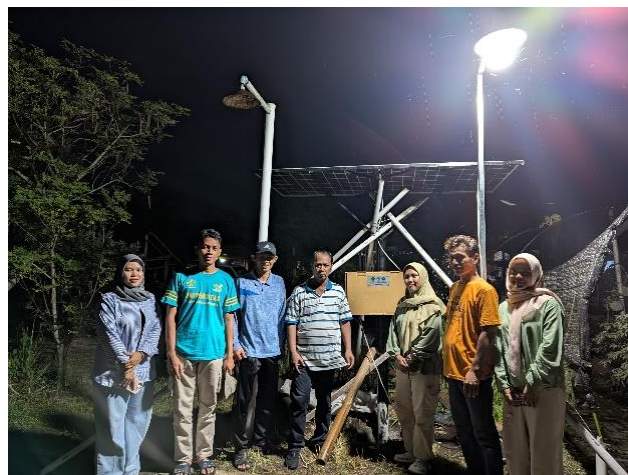
Gambar 5. Uji Coba Lampu PLTS malam hari wisata garam